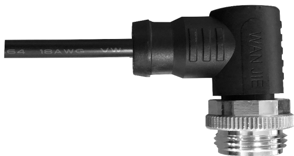
7/8" 公头成型式线缆，弯头